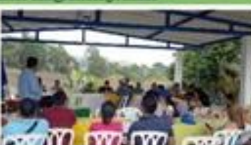
Atención a visitantes