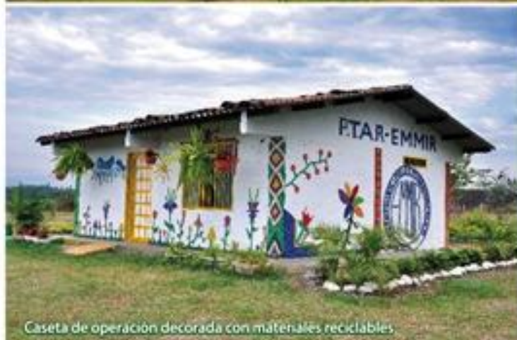
Caseta de operación decorada con materiales reciclables