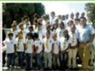
Apoyo a niños scout