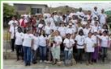
Jornada de limpieza vía Guatemala