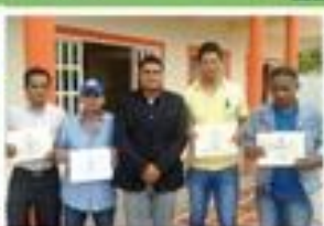
Personal certificado por el SENA