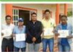
Personal certificado por el SENA