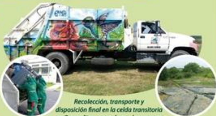
Recolección, transporte y disposición final en la celda transitoria en Granaditas operado por la empresa de servicios de Corinto.

La gestión social con responsabilidad ambiental y el personal adscrito al servicio de aseo con el vehículo compactador han realizado jornadas de limpieza a los sitios críticos, tales como: vía ingreso Corregimiento Ortigal, vía Dellinnox-Santana, vía Planta Acueducto, Av. Centenario-Quebrada el Infernito, Quebrada el Guanábano puente vía la Fortuna, Quebrada el Guanábano Puente vía Guatemala, Puente Río las Cañas vía Corinto, vía Matadero -la Munda, donde la comunidad arroja residuos sólidos, logrando recuperar estos entornos.