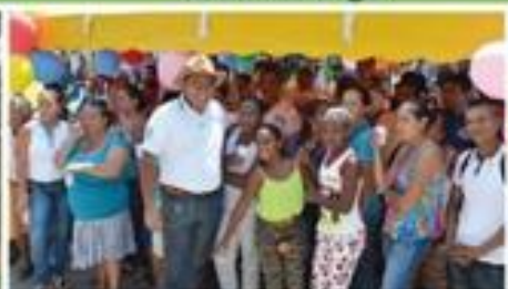
Concurso de fin de año para nuestros usuarios con grandes premios