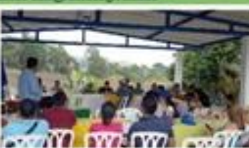
Atención a visitantes