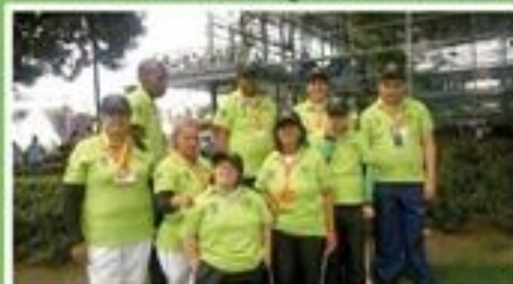
uniformes a nuestro niños especiales FIDES.