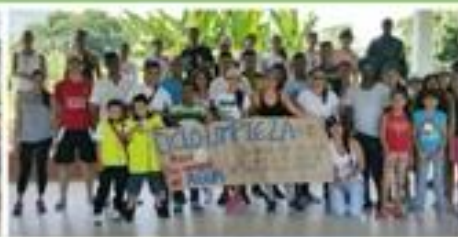
Día mundial del Agua