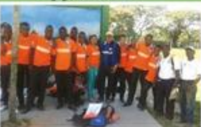
Uniforme deportiva I.E. El Ortigal.